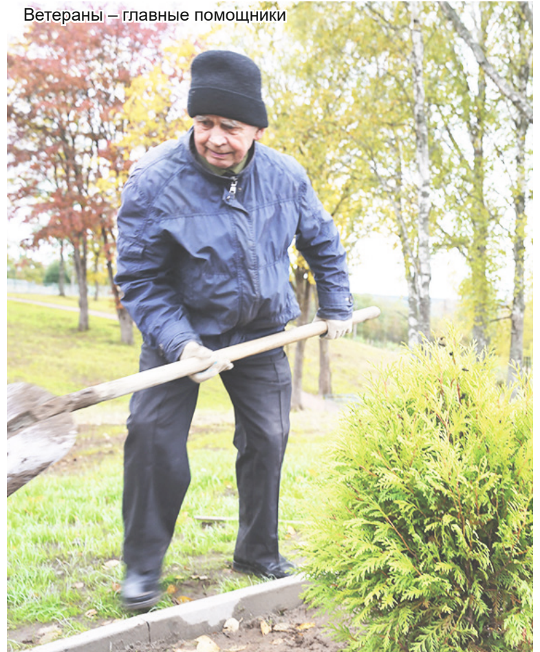
Ветераны – главные помощники