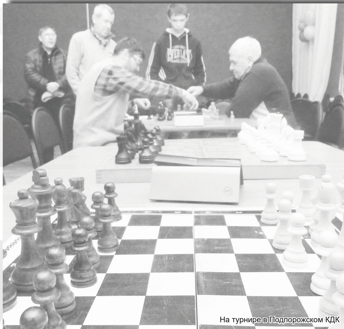
На турнире в Подпорожском КДК

полнительного образования, прошёл специальные курсы по преподаванию шахмат.